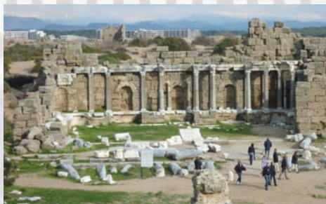
Das Amphitheater in Side