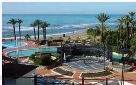
Zimmer mit Meeresblick