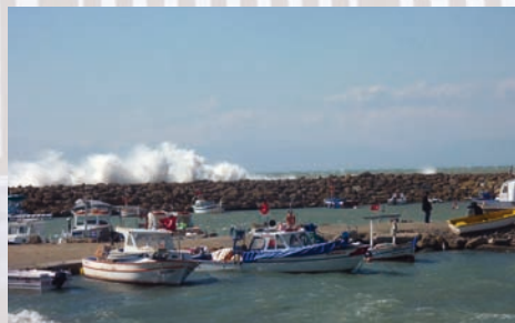
Yachthafen von Side