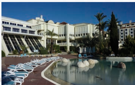
Hotel Sentido Perissa mit dem Pool

Das Sentido Perissa ***** liegt direkt an einem sanft abfallenden Sandstrand, bis ins historische Zentrum von Side sind es 3 km (Busanbindung). In Side können Sie unter anderem den Tempel Apollos besichtigen. Das 6 km entfernte Manavgat lockt mit seinen Wasserfällen. Einen Besuch wert ist auch Seleukeia, eine große antike Stadt, in den Bergen hinter Manavgat gelegen. Das Kursprogramm richtet sich nach dem Kenntnisstand bzw. Lernniveau der Teilnehmer und ist so zusammen gestellt, dass sowohl für Tai Chi Könner als auch für Tai Chi Neueinsteiger ein besonders empfehlenswerter Intensivkurs entsteht. Wir freuen uns bereits heute auf eine gemeinsame gute Zeit.